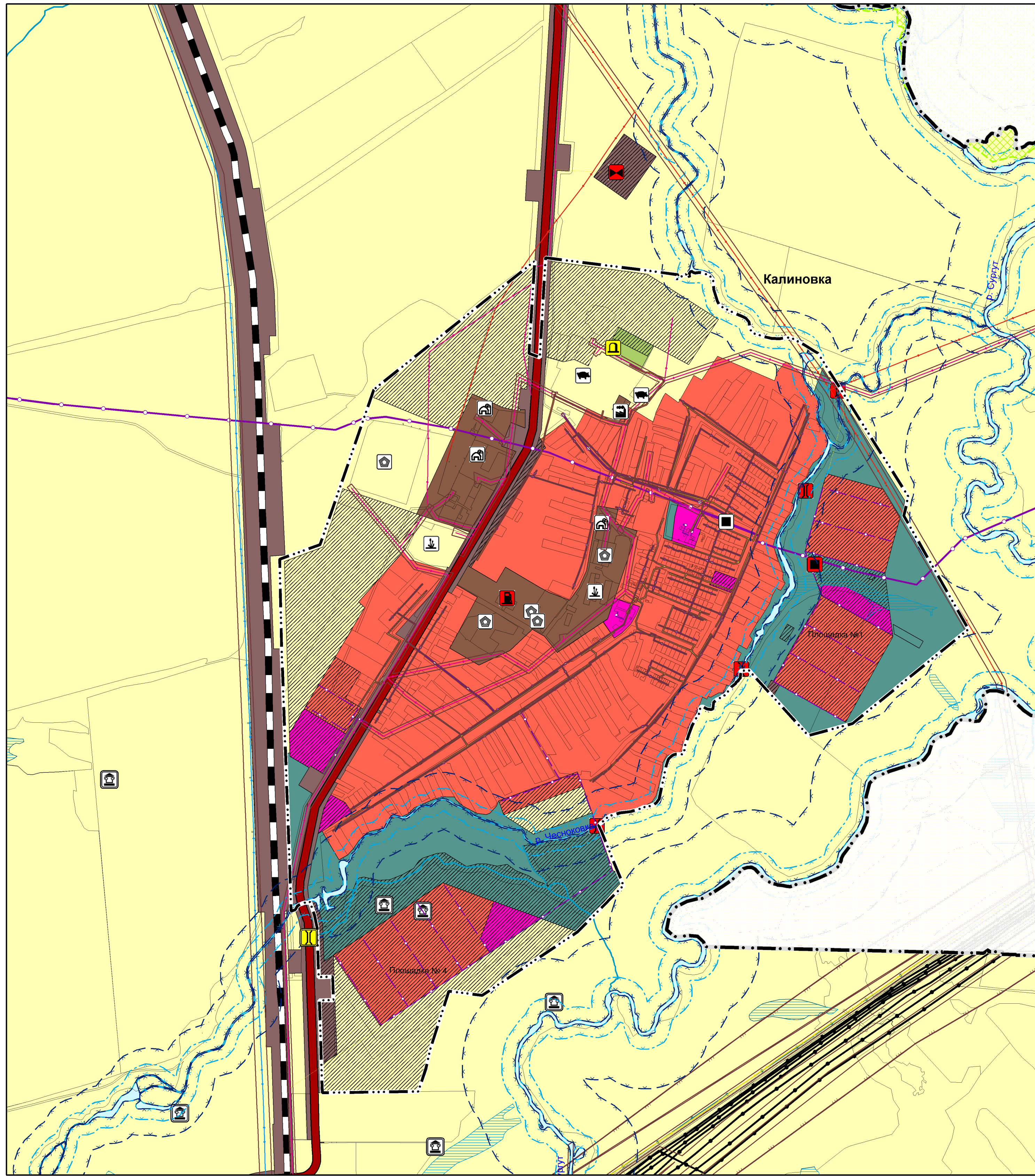
Карта обоснования внесения изменений в генеральный план в части с. Карабаевка муниципального района Сергиевский Самарской области

Карта обоснования внесения изменений в генеральный план в части с. Калиновка муниципального района Сергиевский Самарской области